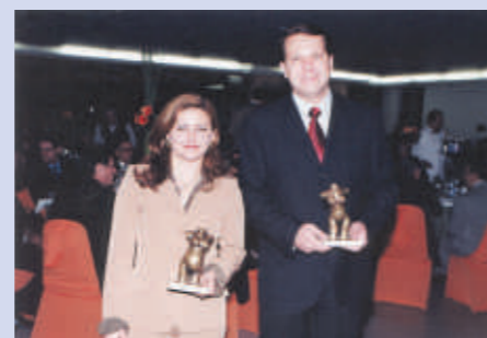
Vencedores dos melhores trabalhos foram premiados durante o jantar de encerramento do Congresso