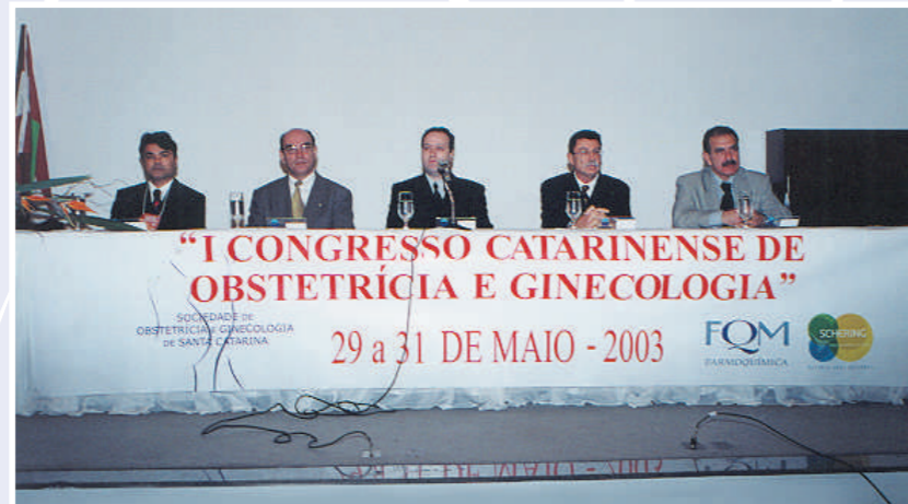
Dirigentes das entidades médicas foram presenças marcantes na abertura do I Congresso Catarinense de Obstetrícia e Ginecologia