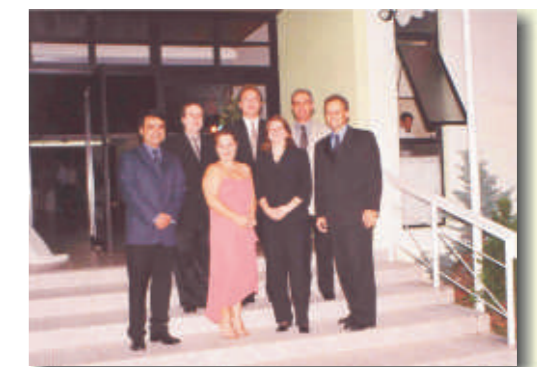
Membros da atual Diretoria festejaram também o Dia do Ginecologista